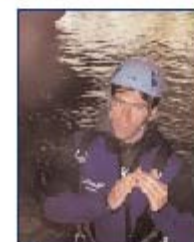
* rocher ne pas sauter "