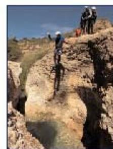
saut - resserrer les bras avant l'entrée dans l'eau