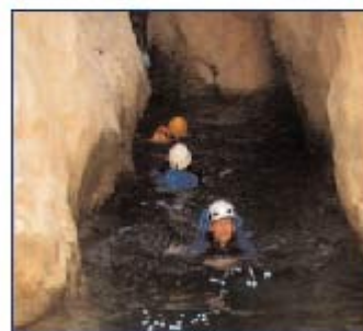
nage dans une étroiture